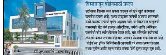
अॅरो टूल्स कंपनीचे नकलपत्र

वाळूजचे ऑरिजन कॅम्प टेक्न 'ऑरिक'मध्ये आणणे विस्तार करित आहेत. २० कोटी अंदा आधी पहिल्या १०० कोटीमध्ये ही गुंतवणूक वाढेल. तेव्हाच आठवारी २० पर्यंत जतन करत नोंद घेण्याचे होईल. पाच महिन्यांत उद्योग सुरू करणारा प्रयत्न आहे. - वृत्त वगैरे, भागीदार, अॅरो टूल्स.