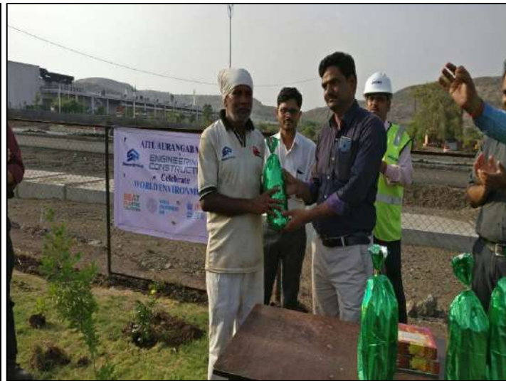
Auric City Celebrated World Environment Day on 5 th June 2018