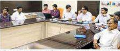
औरंगाबाद : एमआयडीसीच्या कार्यालयात आयोजित लॅण्ड अॅलोकेशन कमिटीच्या बैठकीत उपस्थित अधिकारी.